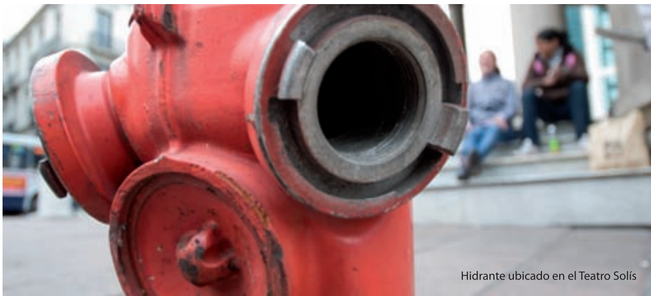
Hidrante ubicado en el Teatro Solís