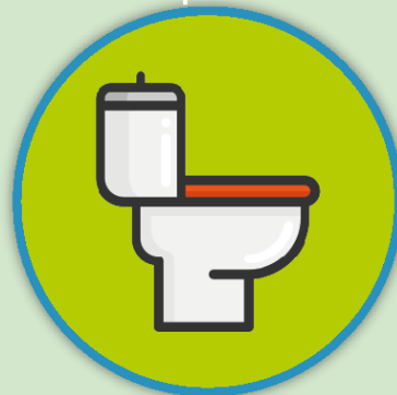
Inodoro o cisterna con pérdida continua