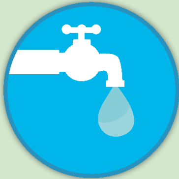
Canilla goteando (1gota/segundo a goteo continuo)