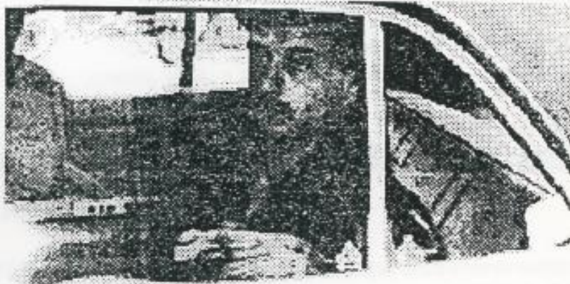
Momentos en que el chileno, copador del domicilio de Malacrida es trasladado en un patrullero