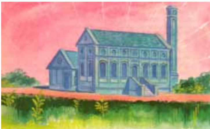
Usina primitiva a vapor ubicada en Aguas Corrientes.

Todas las ciudades disponen de modernas instalaciones para la captación, tratamiento y suministro de agua potable a la población. La ciudad de Montevideo dispone de este importante servicio desde hace 100 años.