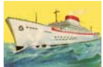
El transatlántico moderno