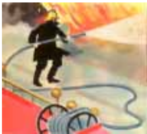
Para apagar incendios.