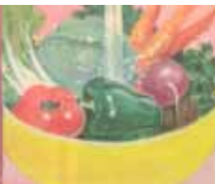
Para lavar las verduras