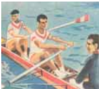
Para el desarrollo físico.