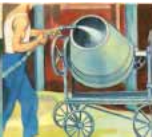
Para las industrias.