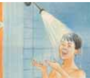
Para el aseo.