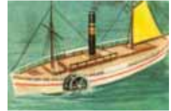
Primitivo buque a vapor

Navegando en esta embarcación a vela, Cristobal Colón atravesó el Océano Atlántico, llegando a las costas de América, el 12 de octubre de 1492.