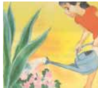
Para regar las plantas