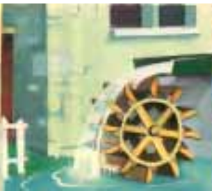
Para producir energía.