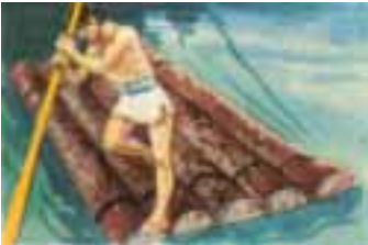
La balsa de troncos

Gracias a los caminos del agua pudo el hombre explorar y conocer el mundo en que habita.