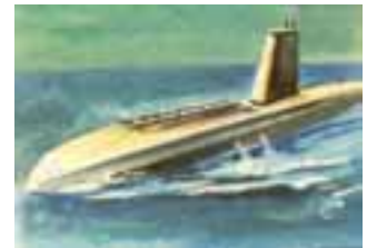
El submarino atómico